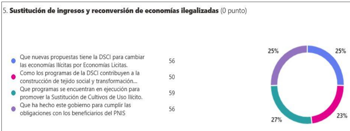
Gráfica 2. Temas de Interés Consulta Ciudadana