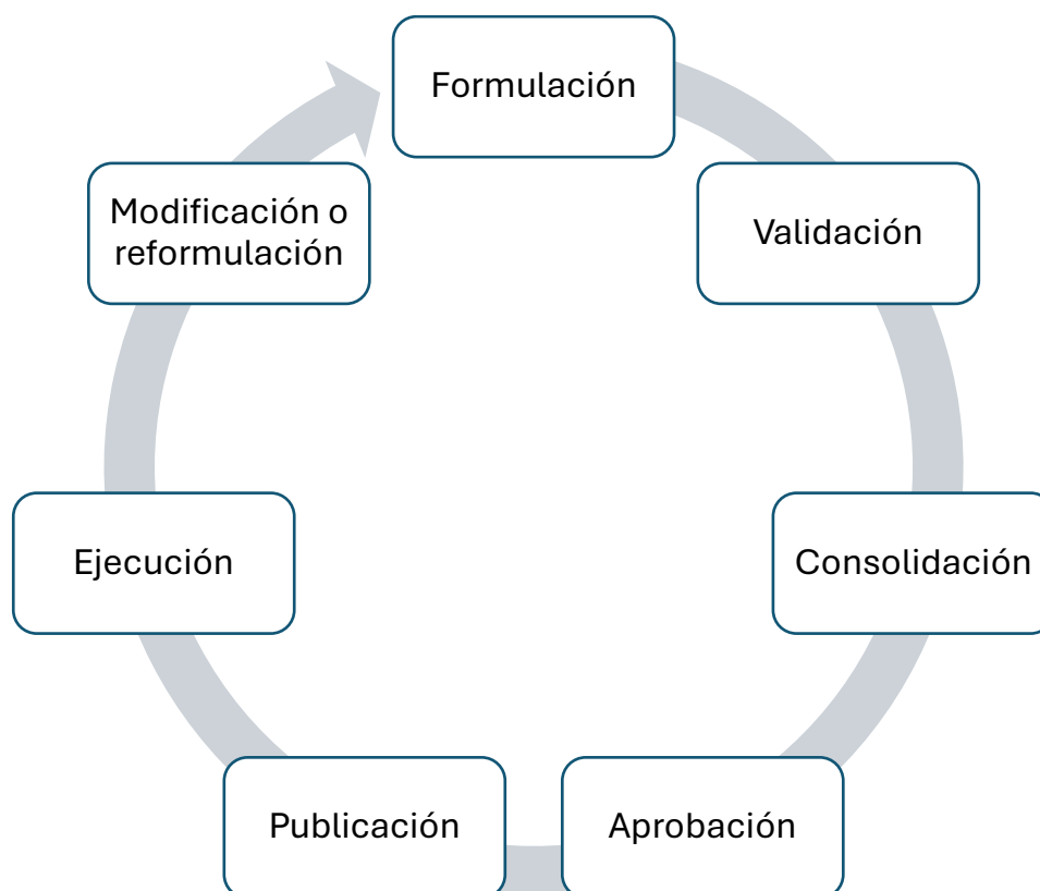
Ilustración 1: Ciclo de formulación del Programa de Transparencia y Ética Pública