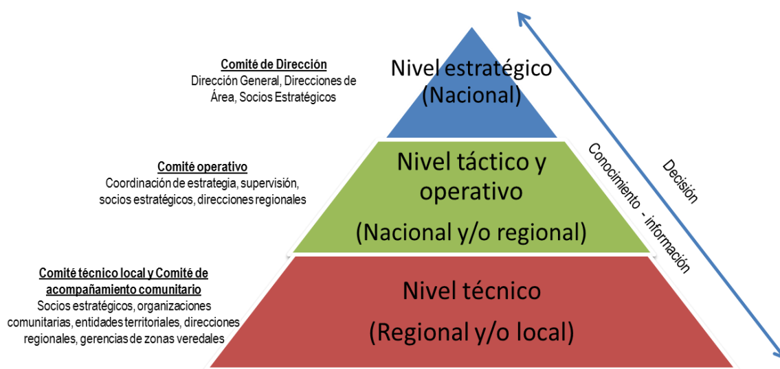
Figura No 2. Niveles de las instancias de decisión, coordinación y seguimiento

En cada nivel participa una o varias instancias de decisión, coordinación y seguimiento, las cuales están conformadas por diferentes actores.